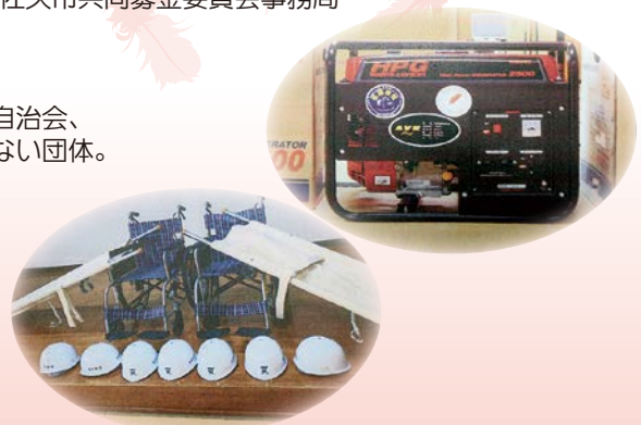
令和6年避難所用物品購入